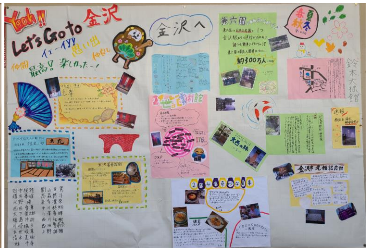
👉 4組 👈