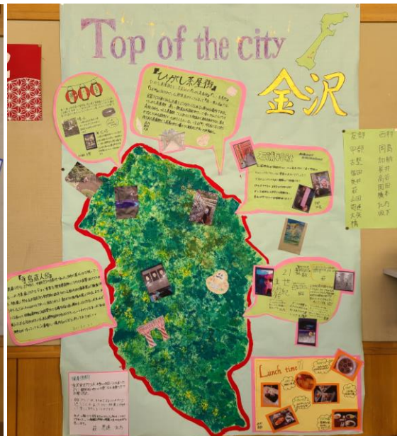
👉 2組 👈