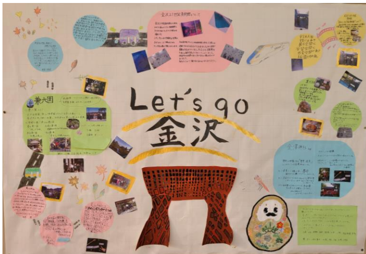
👉 1組 👈