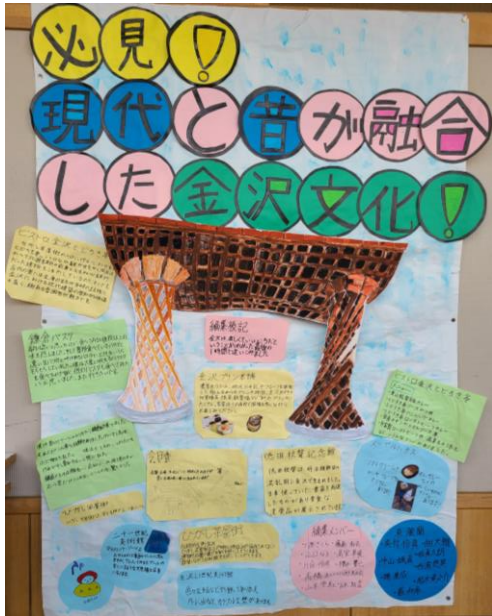
👉 3組 👈