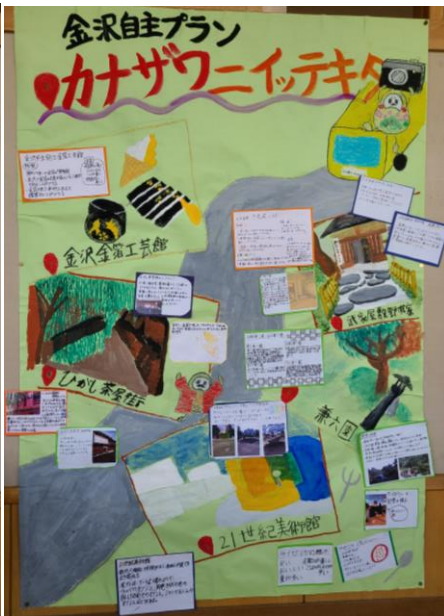
👉 5組 👈