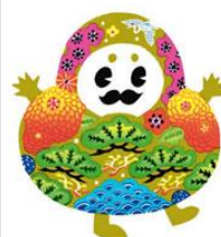
ひやくまんさんも びっくり!