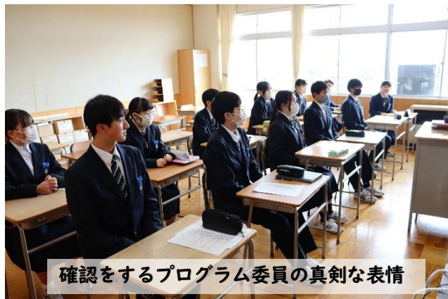
確認をするプログラム委員の真剣な表情

2 年生から 1 年生に、3 年生への熱い思いを伝える場面がやってきました。2 年生にとっては先輩としての初めての試みで、熱心に聞いてくれる後輩たちの視線がより緊張感を増したようでした。説明の後に迷わずメッセージを書き出した様子を見て、しっかりと伝わっていることを実感し、ほっと胸をなでおろしている姿がとても印象的でした。来年度は、最上級生としてこの学校を引っ張っていく立場になります。今回は、最上級生として始動したそんな日となりました。