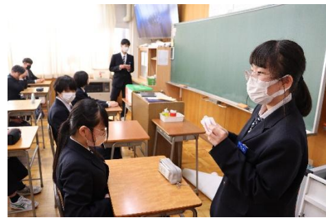
最上級生としての役割を果たせた プログラム委員のメンバー