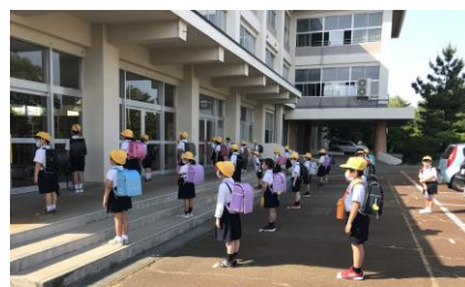
登校はソーシャルディスタンスを保って