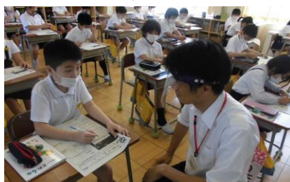
先生はフェースシールドで