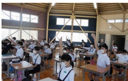
授業中はマスクを着用