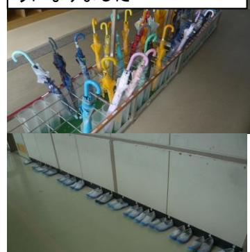
6年生のズックはいつもきれいにそろっています

勢・発表・準備の4つの観点について「8つの約束」を定め、町内全小学校で共通して取り組んでいます。たとえば、あいさつだと「時間とともにあいさつしよう」発表だと『ひじを伸ばして「はい」』というような内容です。2学期より各学級で重点を決め、取り組む内容を学級で話し合い、達成できたら別の内容に挑戦するようにして取り組んでいます。学習の場でも、全員がそろえることを目指してがんばってほしいと思います。