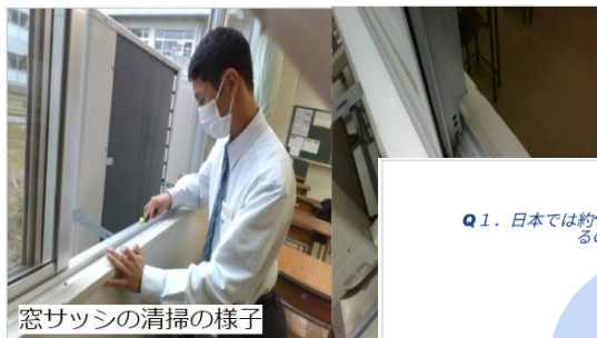
窓サッシの清掃の様子