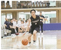
女子バスケットボール部