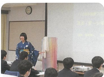
養蚕プロジェクトの講演会