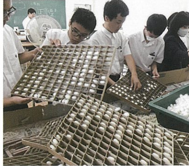
養蚕プロジェクト