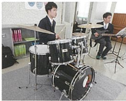
吹奏楽兼軽音楽部