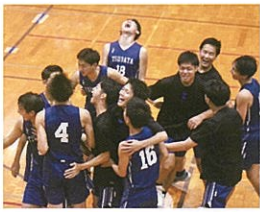
男子バスケットボール部