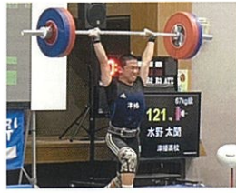
ウエイトリフティング部