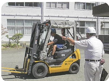
小型重機・フォークリフト講習会