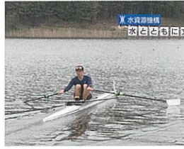
ボート部(ローイング部)