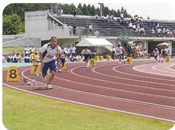
校内陸上競技大会