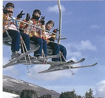
ウィンタースポーツ実習