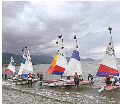
マリンスポーツⅡ実習