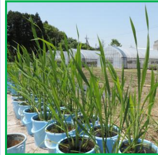
津幡町の特産きんぎょ菜