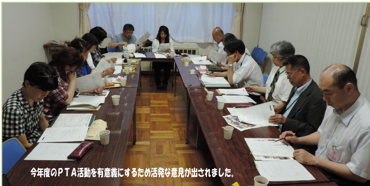
今年度のPTA活動を有意義にするため活発な意見が出されました。

PTA会長、副会長、会計、会計監査の執行部7名と学校職員で、18時30分より本校応接室で執行部会が行われました。今年度の行事予定にプラスして、『PTAが学校に少しでも役立つ活動をしていきたい！』という趣旨で子どもたちのために良いと思われるPTA活動を考え、実行していきたいという活発な意見が出されました。具体的活動として「携帯電話の安全教室」や「制服」について話し合われました。