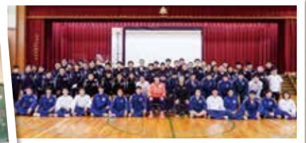
▲オリ・パラ教育 東京オリンピック陸上日本代表 多田修平選手が来校されました。