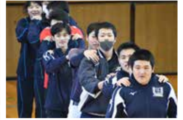
▲運動部合同トレーニング