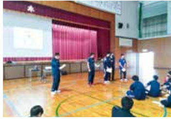
▲スポーツメンタルトレーニング