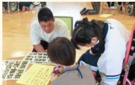
明和特別支援学校交流