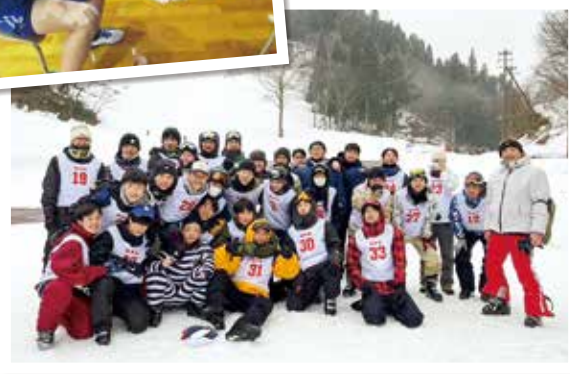
▲スポーツⅤ スキー実習