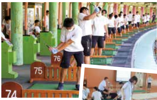
▲スポーツⅤ ゴルフ実習

白山麓の自然の中で行うマウンテンバイク実習やスキー実習、ゴルフ実習の他、全学年で白山登山、キャンプ実習を行っています。他にも外部講師を招いてのテーピング講習、救急救命講習など、スポ科ならではの講習が充実しています。