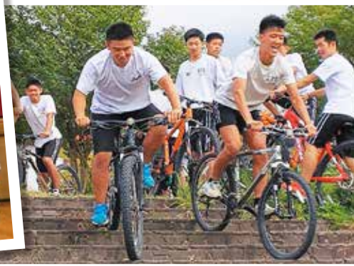
▲スポーツV マウンテンバイク実習