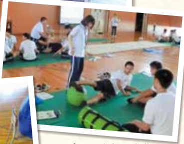
▲スポーツ障害予防講習 ▲テーピング実習