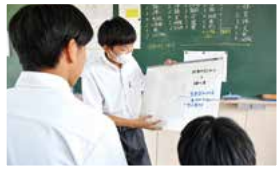
ジオスイーツプレゼン

フィールドワークや小中学校へのお出前授業を通して、ジオパークの魅力を発信します！ 白山手取川ジオパークは令和5年5月ユネスコ世界ジオパーク認定！ （国内10か所目）