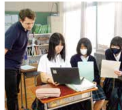
英語コミュニケーションⅢ

※毎朝「朝補習」を実施しています。 ★=必修科目…高校卒業に必要な科目 ○=学校設定科目