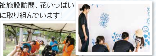
おついち美術館ボランティア