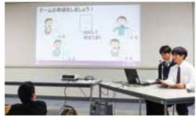
鳥越中ジオ出前授業