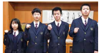
令和5年度は富山大学などに多様な入試を活用して合格しました！