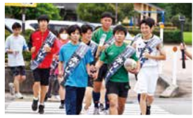
ジオパーク水リレー