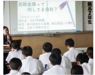
地元企業ガイダンス