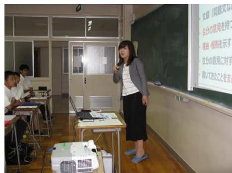
小論文対策講座 (7月26日)