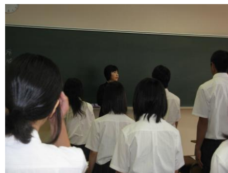
就職マナー講座 (7月25日)