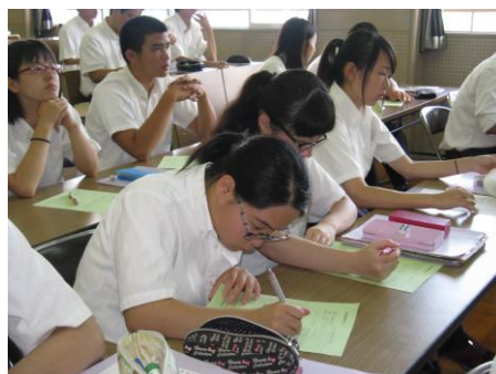
志望理由講座 (8月4日)

てなかなかでてこなかったの、これから自分について考えていかないといけないと思った。