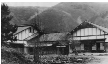
＜当時の白山公民館＞

本校に1枚の賞状が舞い込んできた。「北陸三県高体連スキー大会 長距離16km第1位 昭和26年2月18日」とある。昭和26年といえば「鶴来町外14ヶ村組合立高校」の時代。創立以来8年を経ているが、独立校舎はなく白山公民館の一部を間借りした学校生活。それだけに地元町村も「鶴高生に満足な教育環境を」と財源確保に奔走した。だが、時は戦後不況の混迷期。財源確保にも限界があった。そこで下った方策が組合立から県立高校への移管計画である。生徒たちも県下に鶴高の名をあげんと白銀に勝利のシュプールを描いていったのである。