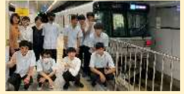
北陸鉄道浅野川線(埴田孝嗣)