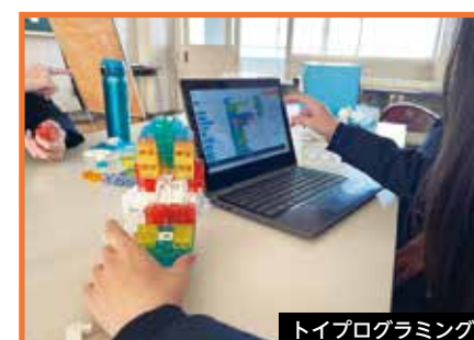
トイプログラミング