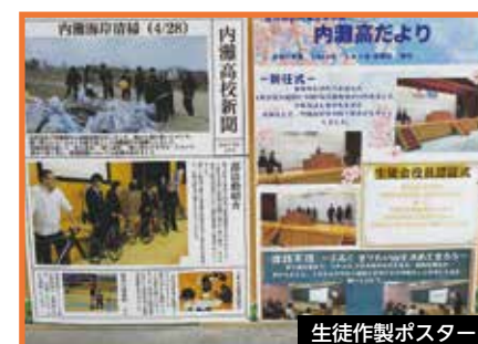
生徒制作ポスター