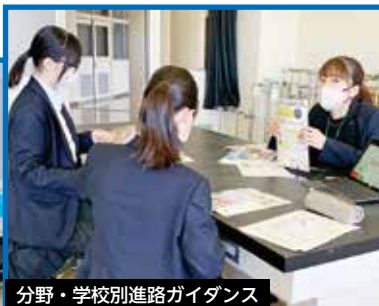
分野・学校別進路ガイダンス