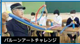
バルーンアートチャレンジ