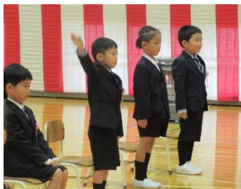
四月七日 ドキドキの入学式

4月7日に令和7年度の入学式が行われ、かわいい1年生6名を迎えることができました。呼名の時には、明るい声で「はい！」と返事ができました。優しい上級生に迎えられ毎日元気に登校しています。