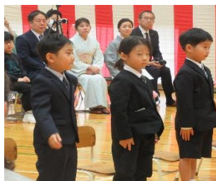
元気によく返事ができました。