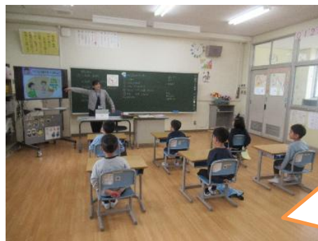
四月八日 授業が始まりました。姿勢よく話を聞いています。