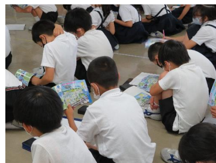
みんな真剣に話を聞いて、メモを取っていました。