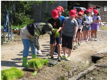
一人一人苗をもらいました。苗を観察する様子も見られました。