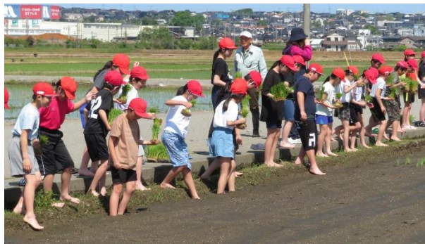
田んぼに恐る恐る足を入れる子どもたち。初めての感触で何とも言えない表情をしていました。