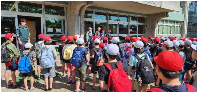
玄関前で出発式を行いました。「行ってきまーす！」