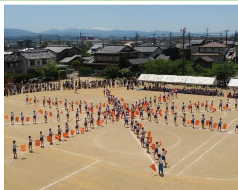
6年集団演技「僕らの番だ！」

保護者の皆様には、今年度も、テント張りや駐車場整理、後片付け、そして、運動会前の除草作業にご協力いただき、本当にありがとうございました。