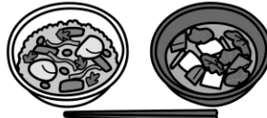
五色ごはん 栄養みそ汁