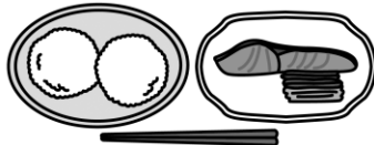
おにぎり 塩ザケ 漬物