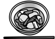
すいとんのみそ汁