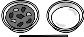
ミルク（脱脂粉乳） トマトシチュー