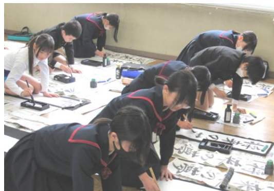
集中して書初めに取り組む 6年生

ご家庭におかれましても、様々な機会を捉え、励ましの言葉をかけていただきますよう、よろしくお願いいたします。