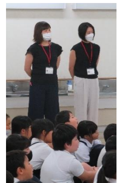
「らしさ」ってなんだろう? 「家族」ってなんだろう? 「ふつう」ってなんだろう? など、性についていろいろな視点からみんなで考えました。