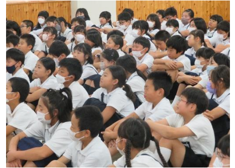
みんな真剣にお話を聞いていました。