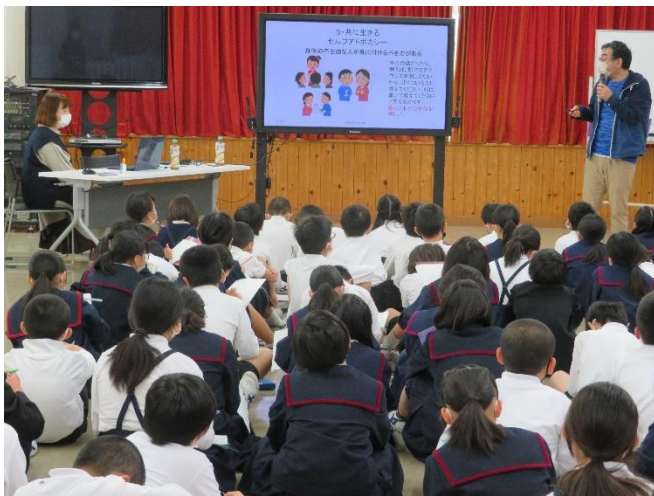
日常生活のことや困っていること、みんなに協力して欲しいことなどをスライドを使って分かりやすくお話していただきました。