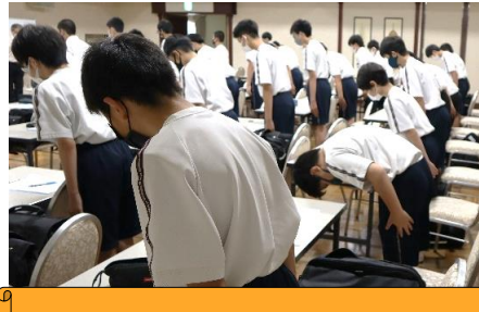
ジョブカフェ石川