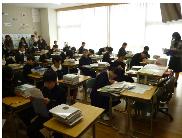
(入学式を終えて、担任の先生と)