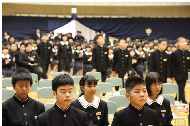
(緊張した面持ちで入場)