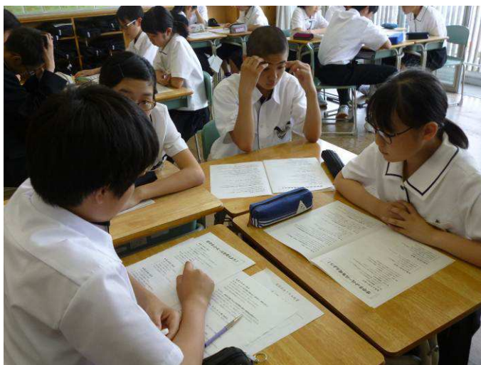
〔どうかなあ？こうかなあ？〕