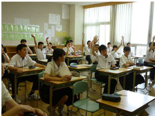
〔1年生教室での話し合いの様子〕

各クラスで話し合われた結果は、6月7日（木）の生徒総会で意見発表され、宇ノ気中学校ネットルールとしてこれからの生活に生かしていきます。ご家庭におかれましても、ネットについてお子様と話し合わせてみるのも良いかもしれません。