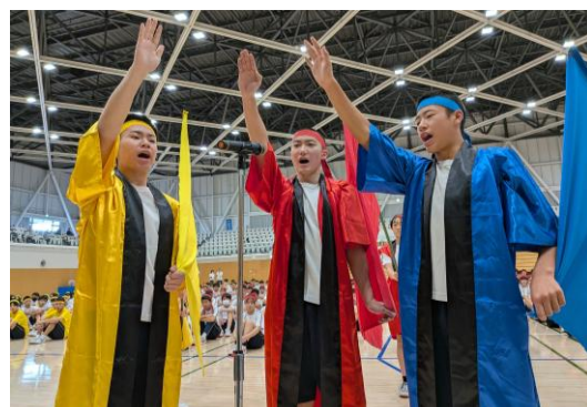
開会式：各団長による選手宣誓

今年度より、かほく市総合体育館での運動会を実施しましたが、各競技の動きや係の役割分担など生徒にとって戸惑うことが多かったと思いますが、生徒会執行部そして各団の応援団長や副団長を中心に、素晴らしいまとまりを見せてくれました。特に3年生の頑張りは見事であり、1、2年生をうまくリードする姿や運動会を楽しもうとする姿勢が見られ、彼らの頼もしさを感じました。私達が目指す誰にとっても「魅力ある学校」に一步前進したそんな1日となりました。