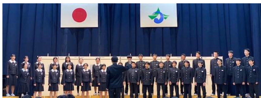
合唱コンクールの様子

10月末からインフルエンザ等による欠席者が増え、今年の文化祭は二部制で実施をしました。生徒会執行部を中心とした実行委員の生徒は急な日程変更にも柔軟に対応をし、2日間の文化祭を盛り上げてくれました。今年も合唱コンクールに向けて、どの学級もどの学年も一生懸命に取り組み、合唱を楽しんでいました。中学生の合唱はクラスの団結力が大きな比重を占め、洗練されていない部分も多いのですが、そこが魅力でもあります。「合唱のチカラ」で絆を深め、活動を通して生徒同士の信頼関係が生まれ、達成感を感じてくれたことと思います。2日間の合唱コンクールそして仲間と放課後の歌の練習で感じた思いなどを大切に、この後の学校生活に繋げてほしいと願っています！