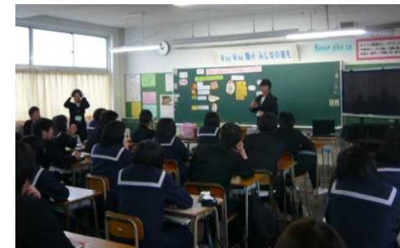
3年1組 保健体育 「生活習慣病の予防」