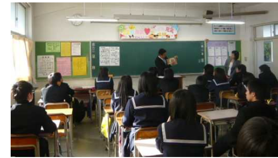
2年2組 学級活動 「コミュニケーションのための食事のマナー」