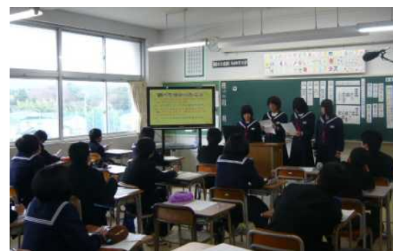
1年3組 総合 「地域の食に関する職業」

昨年の授業に比べて生徒の態度が別人のようになっていたことに大変驚きました。この1年間、どのような指導や取組があったか興味深いです。授業も工夫されていて、生徒の充実感や達成感が表情から読み取れました。