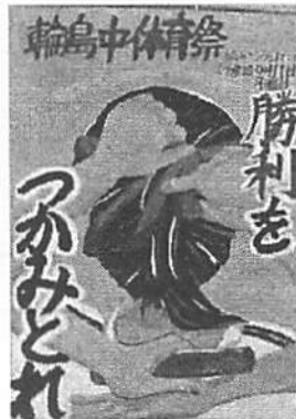
【 2組 】 制作：加治 明莉、小磯 莉子 桜井 華恋、丹尾あやめ