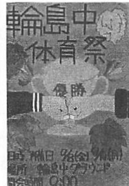
【 3組 】 制作：浦見 志穂 橋本 心花