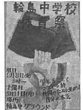
【 4組 】 制作：新家 杏実子 天野 杏香 松下 彩香