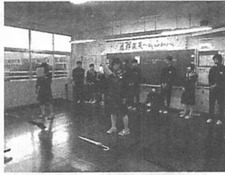
演劇「マイ・ライフ」キャスト