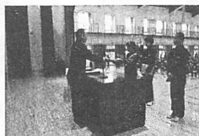
成績優秀者表彰(冬休み明けテスト)