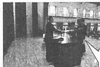
スペコンクラス表彰