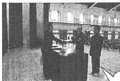
スペコン合格者表彰