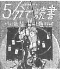
「5分で読書 君は絶対に騙される」