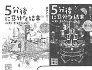
「5分後に意外な結末ベスト セクション 白&黒」