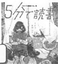
「5分で読書 昨日、失恋した」