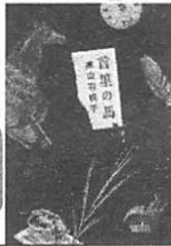
「首里の馬」 芥川賞受賞作