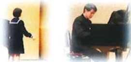
合唱コンクールの様子 上: 3年1組 下: 2年1組