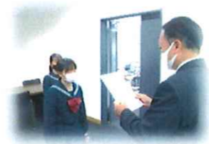
「税についての作品」表彰式