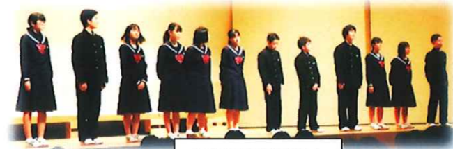
生徒会役員の皆さん