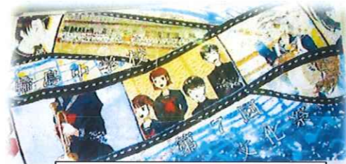
全校生徒で作ったモザイクアート