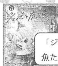
「ジョゼと虎と魚たち」