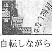
「自転しながら公転する」