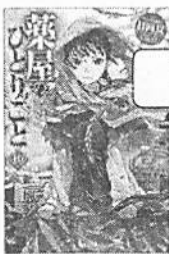
「薬屋のひとりごと 10」