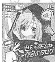
「世にも奇妙な商品カタログ⑤」