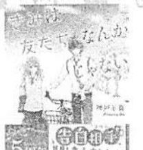
「きみは友だちなんかじゃない」