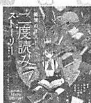
「衝撃のラスト！二度読みストーリー」