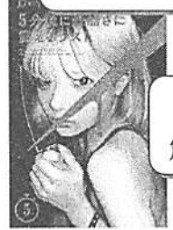
「5分後に残酷さに震えるラスト」