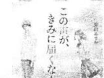
「この声が、きみに届くなら」