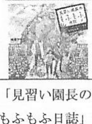
「見習い園長のもふもふ日誌」