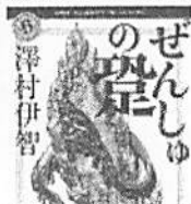
「ぜんしゅの 麓」 ぼきわんシリーズの最新作！