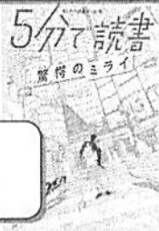
「5分で読書 驚愕のミライ」