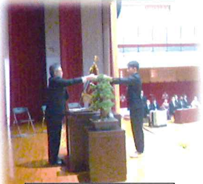
卒業記念品授与の様子