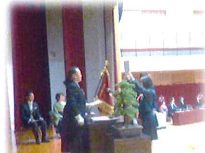
卒業証書授与の様子

保護者、職員に包まれて学び舎を巣立つ卒業生には晴れやかな笑顔や別れを惜しみ涙する姿が見られました。