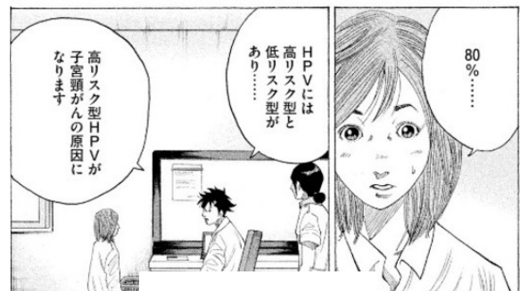
コウノドリ13巻より