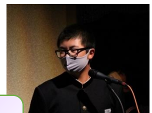
総合の発表「職場体験について」 はっきりとした、いい発表でした。