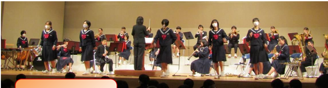
生徒会と作り上げた 「ラ・ラ・ランド」

そして何よりも一番感激したのは「座席にいるときの皆さんの姿勢」です！本当に素晴らしかったです。みなさんは十分に力があるのです！これからの一層の活躍を期待しています！