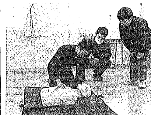
意識の確認。AEDを持って来ました。