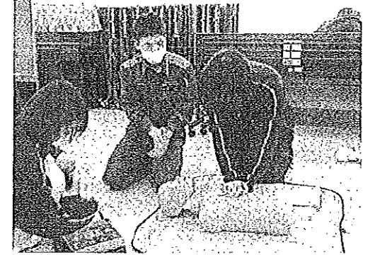
心肺マッサージをしています。