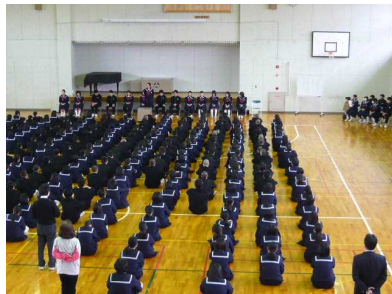
－前期生徒会立会演説会の様子－

輪島中学校のみんなが笑顔で楽しく過ごせる学校をつくりたいという思いを実現するために、力を合わせていきましょう。