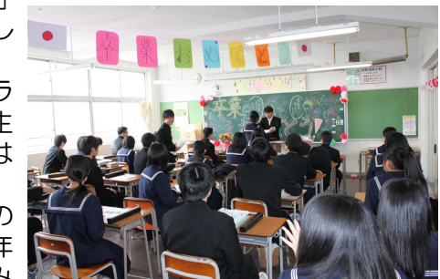
～担任から卒業証書を受け取る様子～