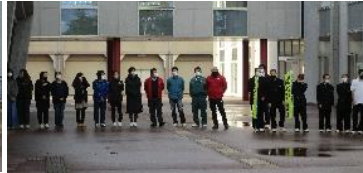
【保護者のみなさん】