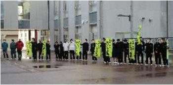
【野球部 1・2 年生】

10月26日(水)に、今年度最後となる親子あいさつ運動が行われました。この日は野球部 1・2 年生とその保護者が参加し、登校してくる生徒や先生方に大きな声であいさつをしました。これまでたくさんの保護者に参加していただきありがとうございました。