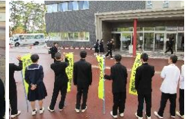
【大きなあいさつです】