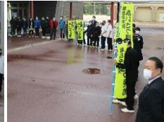
【校長先生も一緒に】