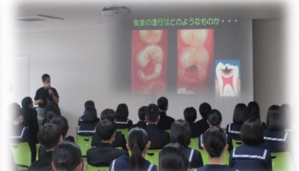
【虫歯が進行する様子】