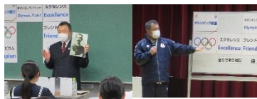
【射撃/ライフル射撃の木田先生】