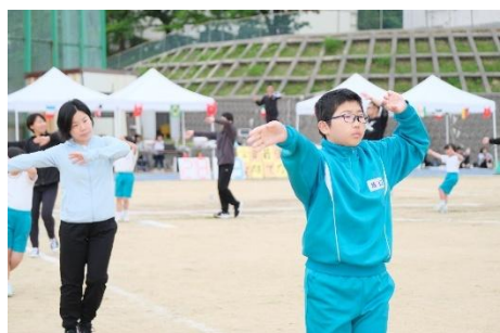
お米ありがとう音頭