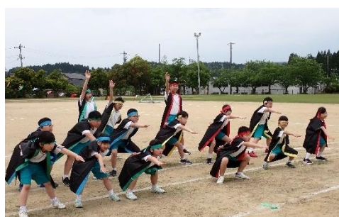
若山っ子ソーラン