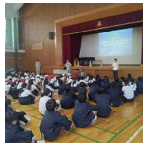
避難訓練(土砂災害)