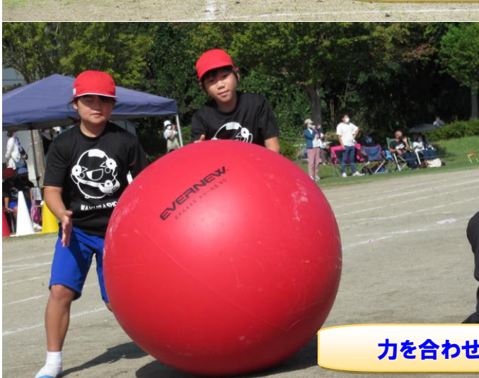
力を合わせて大玉コロン!