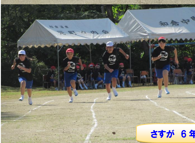
さすが6年生ステキな走り!