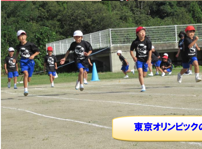
東京オリンピックのような力走!