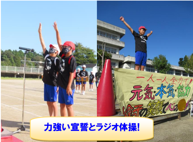
力強い宣誓とラジオ体操!