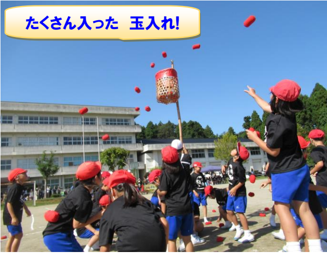
たくさん入った 玉入れ!