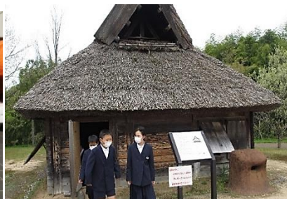
5.6年：県埋蔵文化センターへ