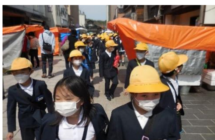
3.4年生：輪島の朝市、柳田満点星へ