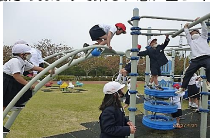
1.2年生：いこいの村、アリス館へ

4月21日（木）低中高の学年で、できる限りの感染対策をしながら、「バス遠足」の学校行事ができました。天候に恵まれ、おいしいお弁当とおやつをリュックサックに詰めて、お家の方のご協力のおかげで楽しい思い出づくりができました。