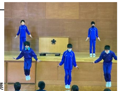
全校児童になわとびの技を披露したさすがの6年生!