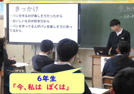
6年生 「今、私は ぼくは」