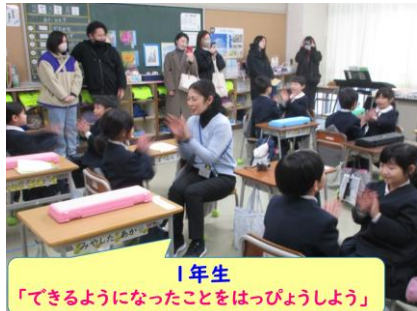
1年生 「できるようになったことをはっぴようしよう」

1月31日（金）は、今年度最後の授業参観でした。保護者の方がたくさんご来校されて、子どもたちのこれまでの学習の成果や交流の様子を参観していただくことができました。また、参観後の感想のアンケートには、どの学年にも大変ありがたいメッセージがたくさん寄せられました。