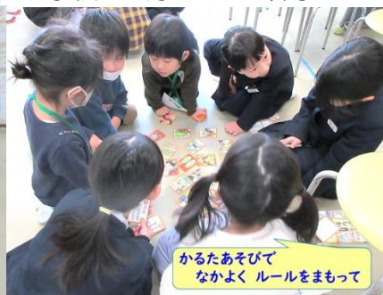
かるたあそびで なかよく ルールをまもって