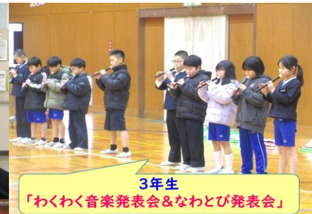
3年生 「わくわく音楽発表会&なわとび発表会」