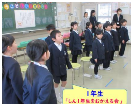
1年生 「しん1年生をむかえる会」

2月に入り、早いもので3学期も折り返しとなりました。どの学年もそれぞれにできることが増えて、大きな成長を見せてくれています。1月30日（木）には「新1年生を迎える会」があり、1年生は4月に入学予定の13名の年長組さんたちに音読や計算、なわとびなどの「できるようになったこと」を大きな声で堂々と発表してくれました。かるた遊びをしたり、学校探検でやさしく校内を案内したりしていました。小学校に入学して1年間でこんなにたくましく成長しました。