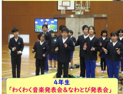
4年生 「わくわく音楽発表会&なわとび発表会」