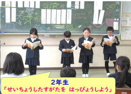
2年生 「せいちょうしたすがたを はっぴようしよう」