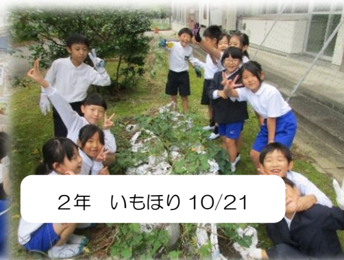
2年 いもほり 10/21