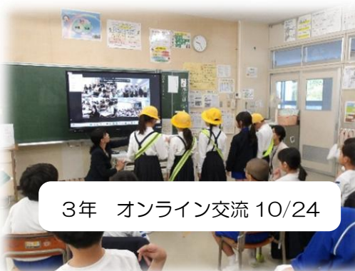
3年 オンライン交流 10/24