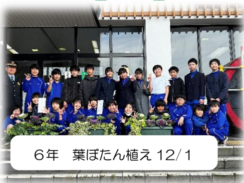
6年 葉ぼたん植え 12/1