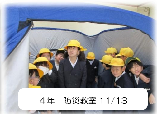
4年 防災教室 11/13