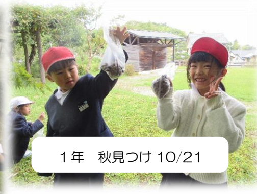
1年 秋見つけ 10/21